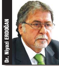
Başkan Yardımcısı Vice president