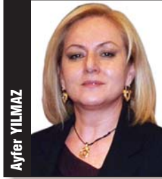
Başkan Yardımcısı Vice president