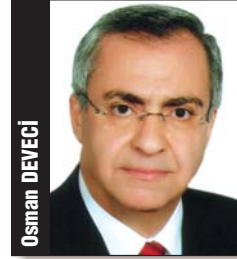
Başkan Yardımcısı Vice president