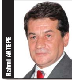
Genel Sekreter Secretary General